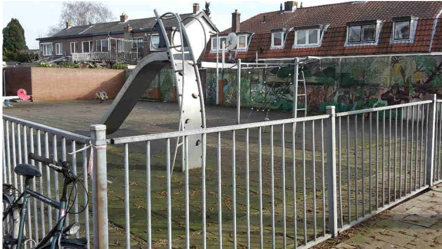
Speeltuin Hoge Larenseweg

De speelplaats aan de Hoge Larenseweg is aan herinrichting toe. Als herinrichting plaatsvindt, kan het trottoir naast het speelplein iets worden verschoven waardoor drie langspaarkeerplekken kunnen worden gerealiseerd. De herinrichting gaat plaatsvinden in overleg met de bewoners.